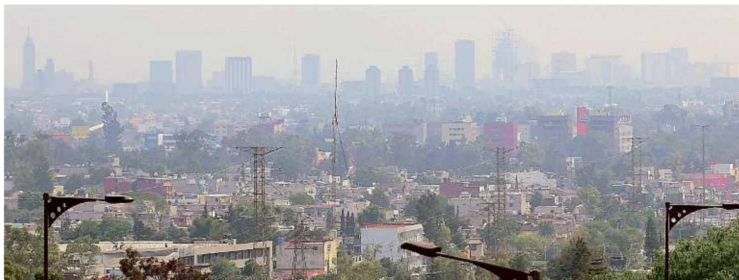
El índice de contaminación por ozono alcanzó ayer, a las 15:00 horas, los 161 puntos en la Ciudad de México.

La revista especializada Chambers define a Natera Consultores como "firma boutique con habilidad excepcional para integrar los precios de transferencia con la planeación aduanera y fiscal global, generando un solo proceso dinámico".