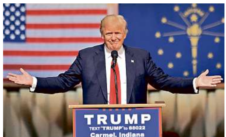
El precandidato republicano hizo campaña ayer en Indiana.